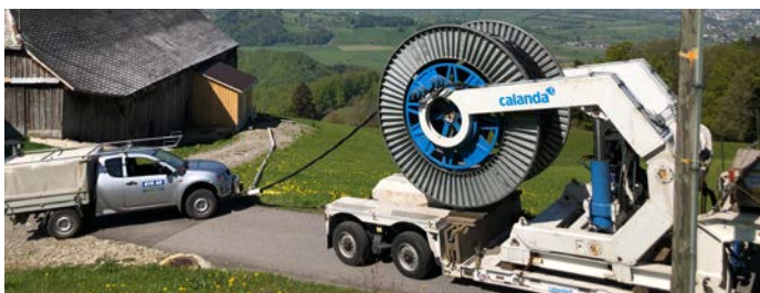
Spezialverlegefahrzeug bei TS Sommerig